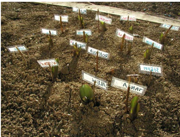
15. März 2004 (Rückseite)