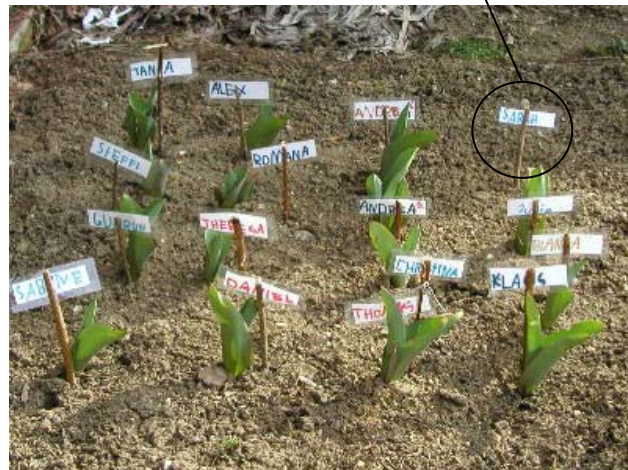
19. März 2004