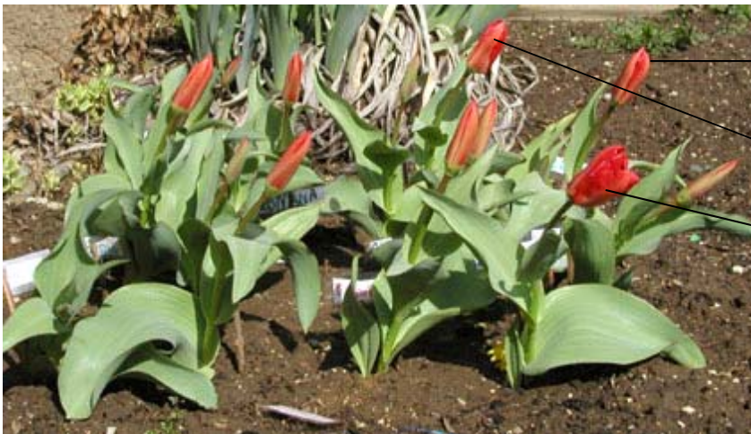
5. April 2004